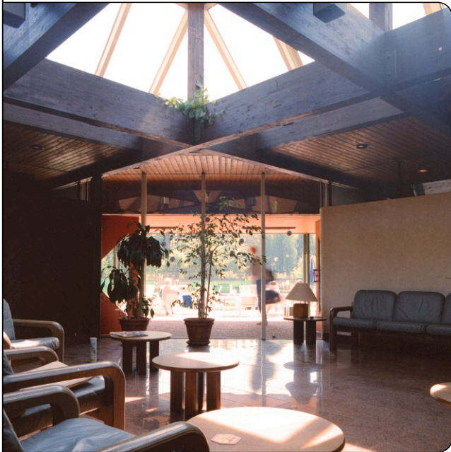
Ausblick auf die Außenplätze