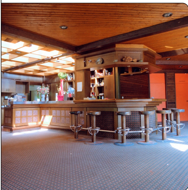
Theke im Vereinsheim