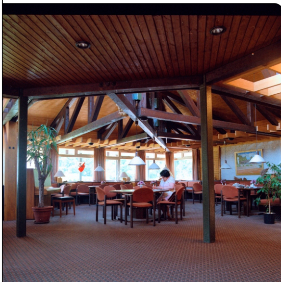
Blick in die Vereinsgaststätte

Neben dem Gelände der Stuttgarter Bundesgartenschau von 1977 entstand ein Jahr vorher die damals modernste Tennishalle Deutschlands, ausgestattet mit 2200 m 2 MULTIBETON-Fußbodenheizung und einer Dämmung aus Isopor und Styropor. Als Wärmequelle wurde eine Gasheizung gewählt, wobei die Möglichkeit, die Energie aus dem Grundwasser oder der Sonne zu beziehen ausdrücklich mit eingeplant wurden.