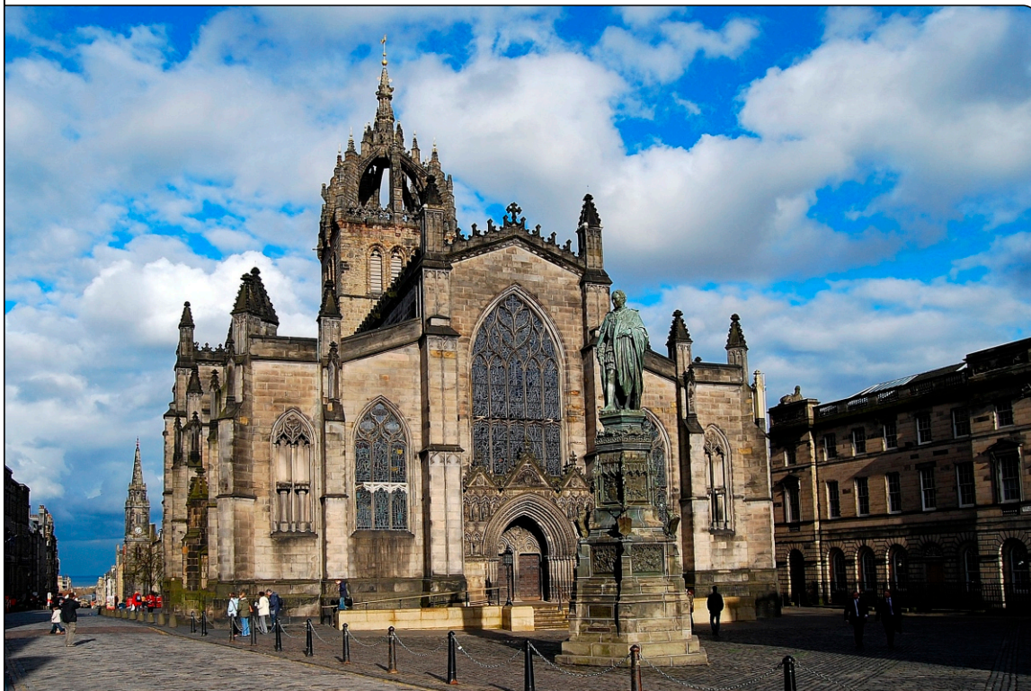
Außenansicht der Kathedrale