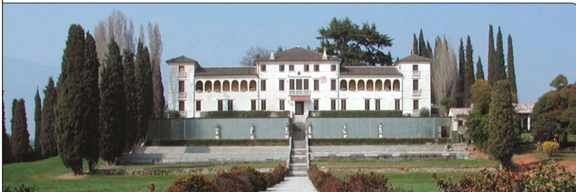
Außenansicht der Villa