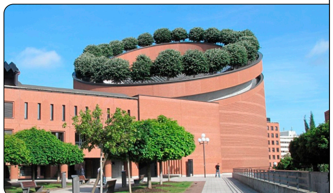
Silberlinden, Foto: derivative work: Rabanus Flavus, CC BY-SA 3.0