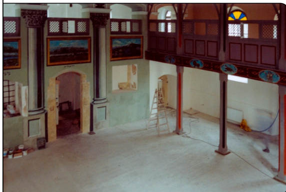
... und nach der Estrichverlegung und Restaurierung der Wandmalereien aus den 1920er Jahren

Die im 1643 erbaute Synagoge Kupa im früheren jüdischen Viertel von Krakau im Stadtteil Kazimierz wurde 2001 mit einer MULTIBETON-Fußbodenheizung ausgestattet. Für die Fläche von 200 m 2 wurde durchgängig Verlegeart A 30 gewählt, da die gewünschte Raumtemperatur nur 12 °C betragen soll. Als Oberboden wurden großformatige Fliesen aufgebracht.