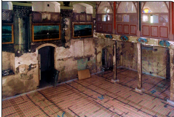
Innenansicht während der MB-Verlegung ...