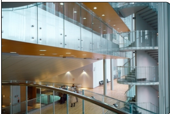
Blick in die Vorhalle

Die „Artur Rubinstein-Philharmonie“ (Filharmonia Łódzka im. Artura Rubinsteina) wurde 1915 gegründet und erhielt 1984 ihren heutigen Namen. Orchester und Chor der Philharmonie treten weltweit auf und sind oft für die Filmproduktionen der Filmhochschule Łódź tätig. 2002/2003 wurde der dann im Dezember 2004 eingeweihte Neubau in der Narutowicza-Straße mit einer MB-Fußbodenheizung ausgestattet. MB-Partner BAJ aus Sosnowiec verlegte 2.800 m 2 MB-Estrichsystem 17 in allen Etagen und der Tiefgarage. Als Oberboden kamen Fliesen, Naturstein und Parkett zum Einsatz sowie Zementboden in der Tiefgarage.