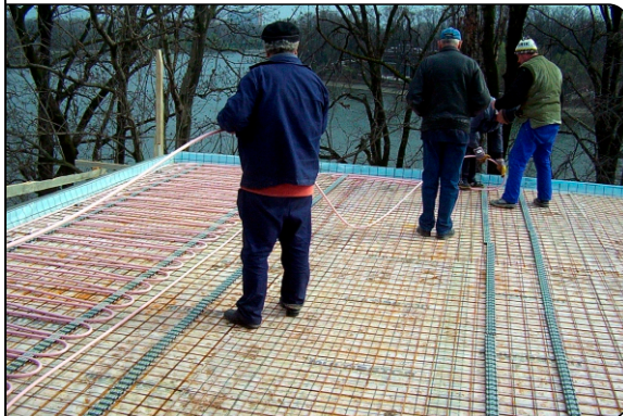
Verlegung auf der Terrasse