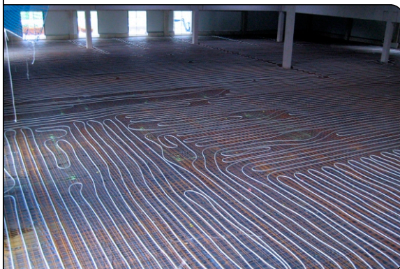
Blick auf die Verlegung der Heizrohre