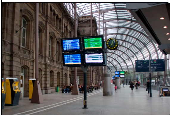
beheizte Vorhalle zwischen den Fassaden

Zur bestehenden Fläche von 837 m 2 kamen weitere 1964 m 2 , zusammen also 2801 m 2 mit dem MB-Estrichsystem 17 beheizte Fläche. Dies entspricht 19990 m Rohr, montiert in 2420 m MB-Stahl-Clipsschiene. 206 Heizkreise wurden an insgesamt 21 Verteiler, die unter dem Hallenboden installiert sind, angeschlossen.