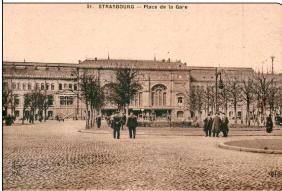
Ansicht in den 1920er Jahren

Der neue Glasvorbau des Straßburger Bahnhofs stülpt sich wie ein riesiger Kokon über das historische und denkmalgeschützte Gebäude. Architekt Jean-Marie Duthilleul entwarf zusammen mit dem Ingenieurbüro RFR eine Glashalle, die sich auf einer Länge von 120 Metern und 25 Meter hoch scheinbar berührungslos über das bestehende Gebäude legt.