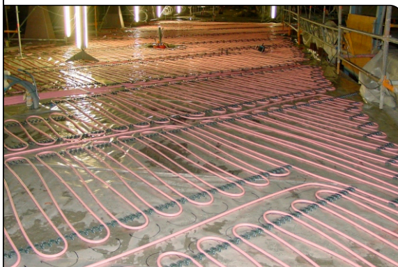
verlegtes MB-Euro-Systemrohr in Stahl-Clipsschiene