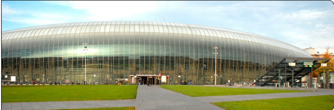
Neue Glasfassade des Bahnhofs