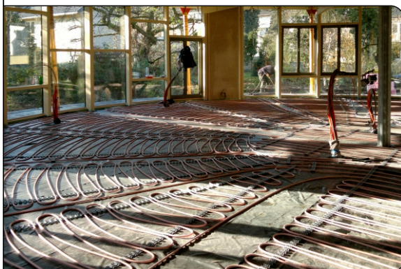
Verlegung des Systems MB-Estrichsystems