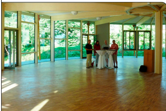
Gemeindesaal im Endzustand

Rund um das ehemalige Pfarrhaus hinter der Friedenskirche entstand das Evangelische Gemeindezentrum Remagen. Als halbrunder Anbau verdoppelt der Gemeindesaal das Raumangebot des Zentrums. Auf einer Fläche von rund 700 m 2 bietet das Haus u.a. Räume für die Jugendarbeit, die Gemeindebücherei, den Eine-Welt-Laden und für Diensträume.