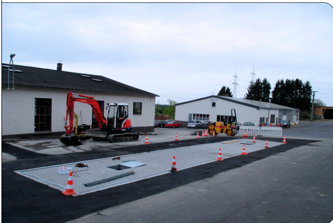
Waage nach der Asphalteinbringung