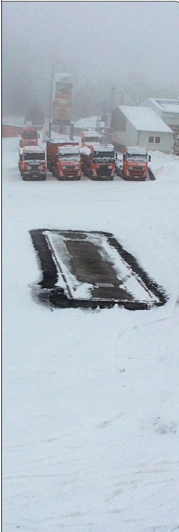
erfolgreich schneefreie Waage

Die Spedition und Pelletshandlung Mann Naturenergie in Langenbach im Westerwald erhielt 2014 eine neue Waage. Um sie auch im Winter nutzen zu können, wurden Waage und Umrandung mit einer MULTIBETON-Freiflächenheizung versehen. Die Heizung unter der Waage wurde nach der Verlegung von unten unter die LKW-Stellfläche geschraubt, um die Waage herum wurde das System MB-Asphalt verlegt, um die LKWs gefahrlos verlassen zu können.