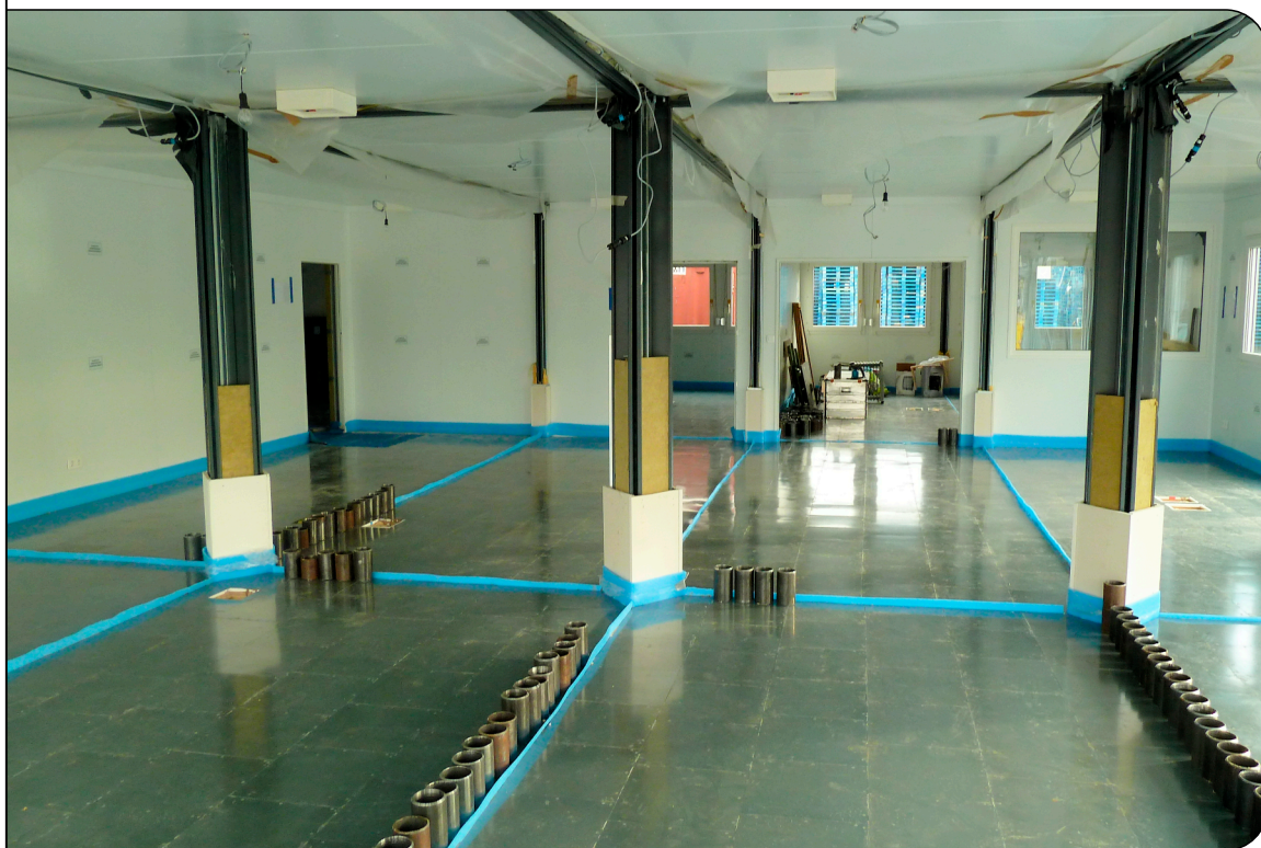
Blick in die Halle mit verlegten MB-Stahl-Deckplatten