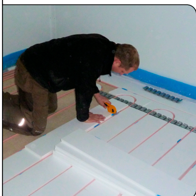
Verlegung des MB-Fertigbodens S18