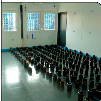
Verlegung der MB-Stahl-Deckplatten

Die Firma Baumann aus Bonn bietet alles, was mit Containern zu tun hat: Vom Fracht- und Lagercontainer über Messe- und Eventcontainer bis zu Wohn-, Büro- und Mannschaftscontainern. Besonders spezialisiert ist die Firma Baumann auf modulare Raumsysteme - von der Planung über den Transport bis zur schlüsselfertigen Montage.